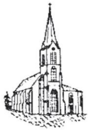
Spahnharrenstätte St. Johannes der Täufer